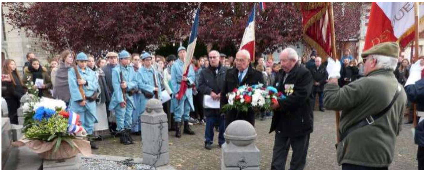
Défilé, dépôt de gerbes et minute de silence au monument aux morts, pour saluer la mémoire des civils et militaires fauchés si violemment lors de ce terrible conflit.

Nombreuses étaient les personnes réunies le 11 novembre dernier pour commémorer le 100 ème anniversaire de la fin de la Première Guerre mondiale. En cette période troublée par de trop nombreux conflits sur notre planète, il est essentiel de perpétuer le souvenir, de commémorer la victoire, mais surtout de célébrer la paix. Retour en images.