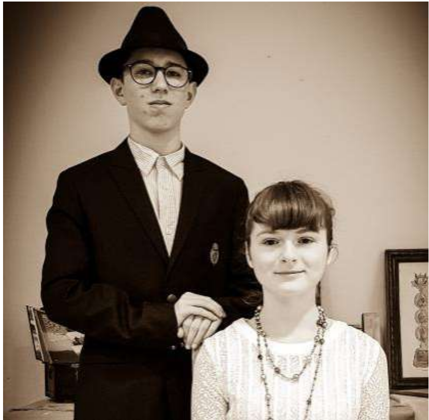
Il s'agissait là d'une très belle commémoration pour tous ceux tombés au champ d'honneur un siècle plus tôt.